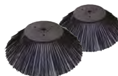
BALAI LATÉRAL PPL STANDARD X 2 SPPV00018