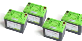
BATTERIE GEL X 4 BAAC00106 1250E/1280E