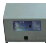
CHARGEUR UNIVERSEL BACA00134 1250E/1280E