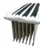
FILTRE POLYESTER (POUR 1280) FTDP00214